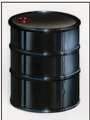
Barile di petrolio