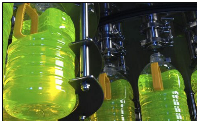
Industria di lavorazione plastiche