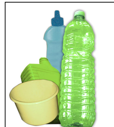
Imballaggi in plastica