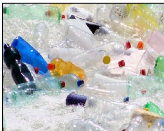
Materiale in stazione ecologica